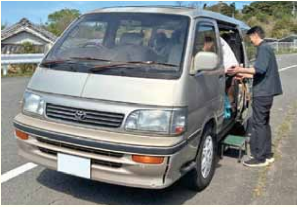
買物サロン、いざ出発

答 バスを利用してもらった り、買物サロンについても、 月2回になったら民業圧迫とい う形にもなるので、理解してほ しい。