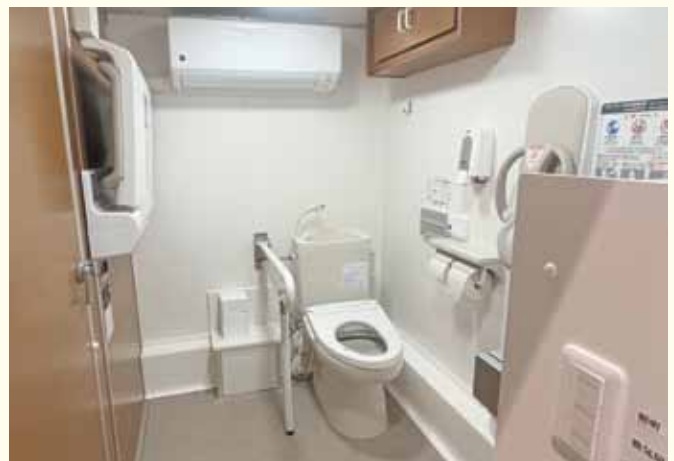
快適に使えるトイレ

答 被害を受けたときに、よそから手伝いに来てもらいたい。それだけトイレが重要であるという認識の下で至ったわけだ。