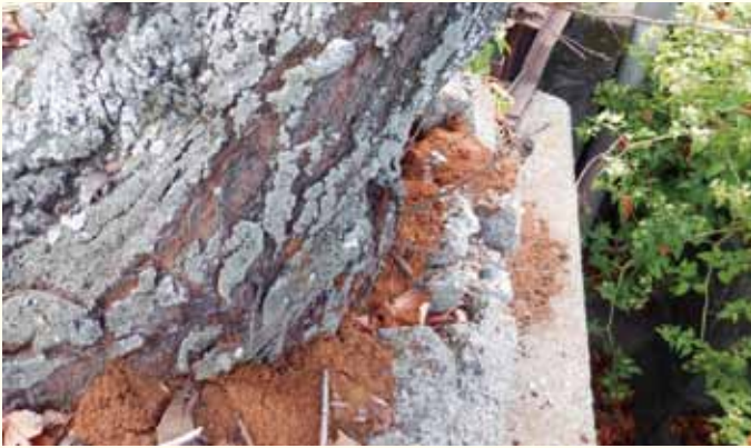
防除費用に対する個人向けの補助制度が創設