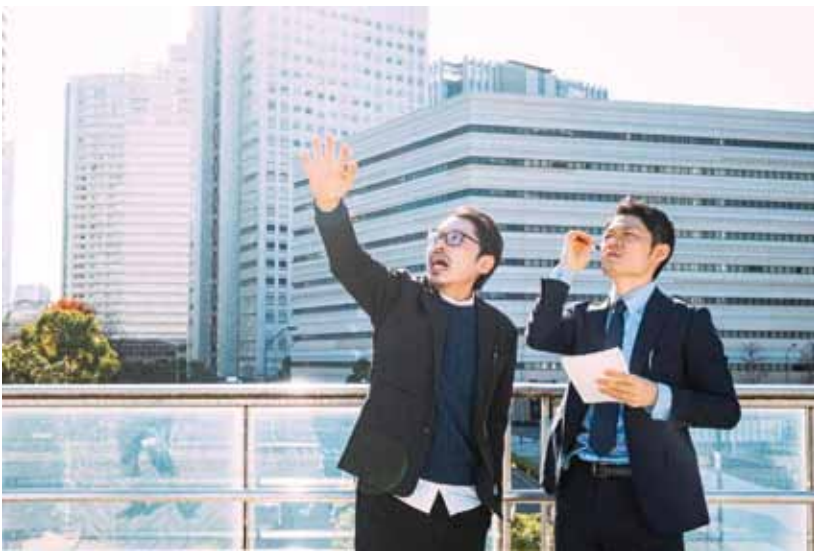
都会へ若者が流出する