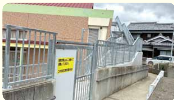
町道から直接上がれる避難階段