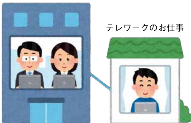
テレワークのお仕事

町長 働きたいと思える魅力を発信するのは非常に難しく、できていない。若者世代の希望する職業が少なく、就職するには地元を離れなければならない。 質問 若者に雇用の場を確保できているのか。 町長 昭和44年に御坊日高地区求人対策協議会が発足したが、今年度で解散になる。