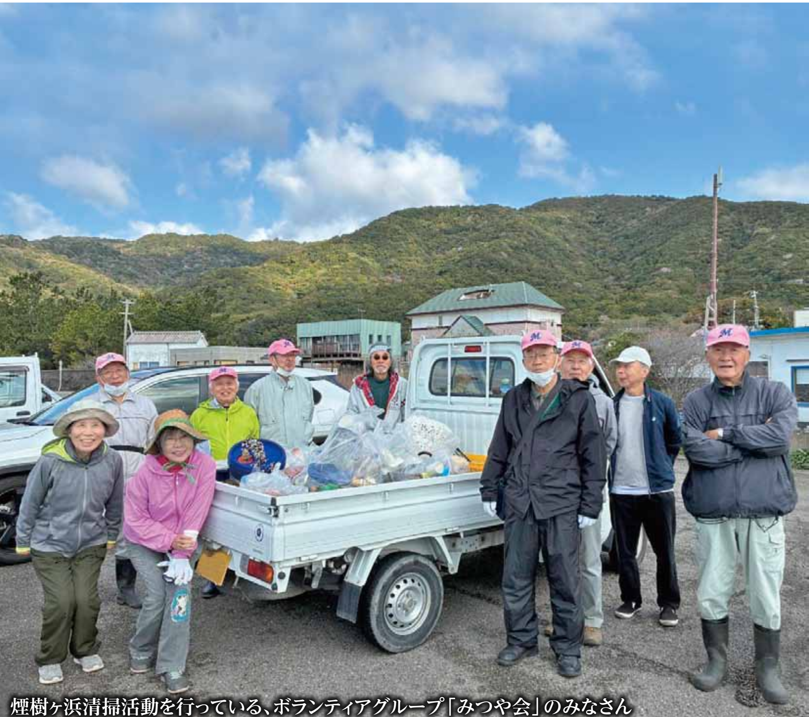
煙樹ヶ浜清掃活動を行っている、ボランティアグループ「みつや会」のみなさん