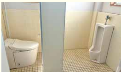
集会場トイレを今後、男女別に