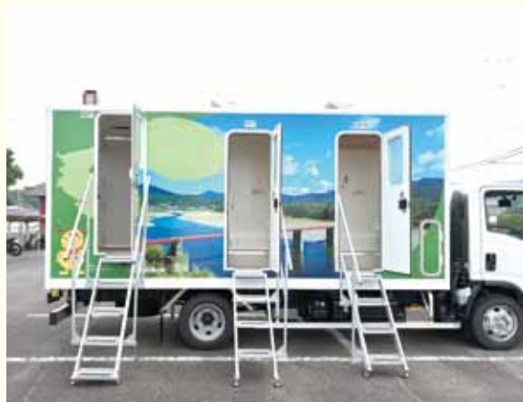
すぐに使える移動式トイレカー

答 何かあったときに、他からも手伝いに来てもらえるというのが「助けあいジャパン」なので、我々としたらこの「助けあいジャパン」のトイレカーを購入しようという最終的な結論に至った。