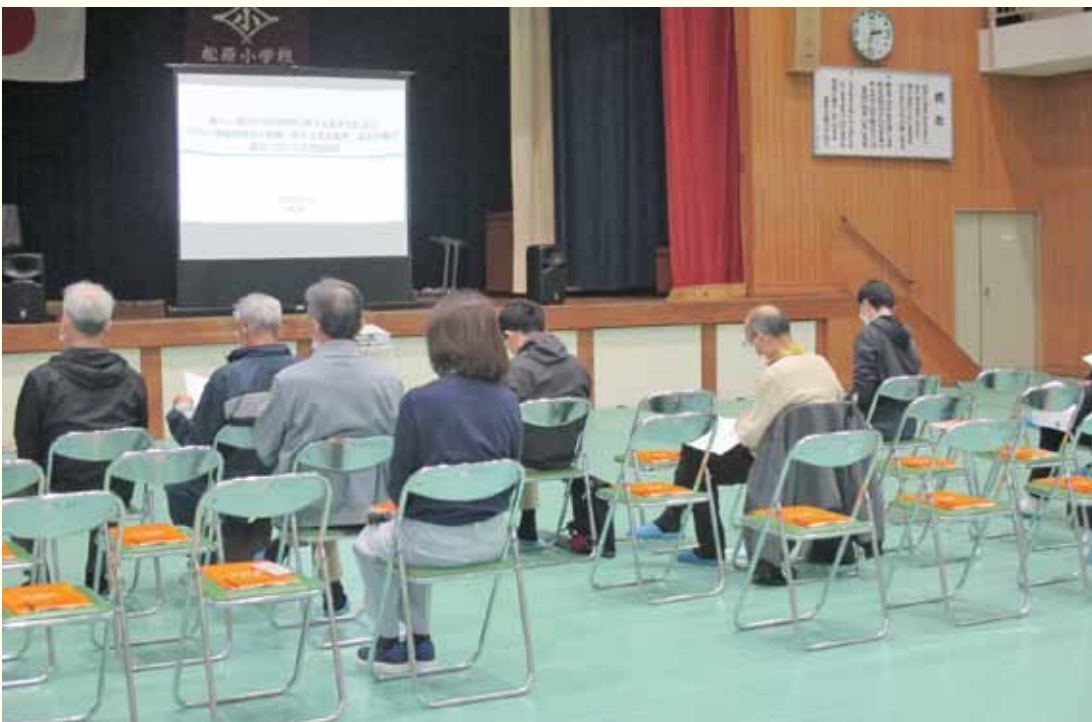
住民説明会の様子