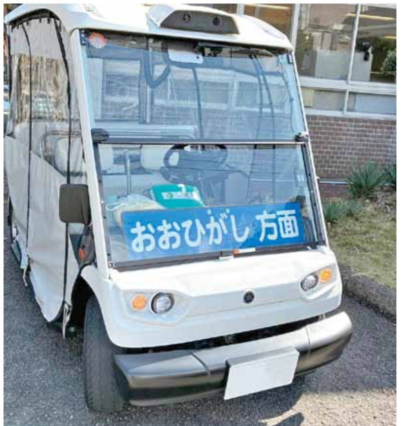
国の支援を受けた狭い道を走る自動運転カート（太地町）

町長 住民が助け合って移動を支える、お互いさまというような乗り物支援など、民業を圧迫しない程度に実費を負担してもらって、操業を行うようなボランティア活動など、高めてもらえるとうれしい。