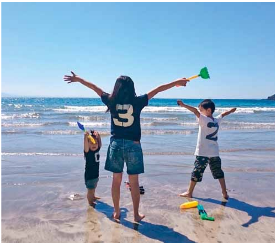
未来ある子ども達

ふるさと納税は半分しか残っていない。どんどん補助していたら町はもたない。全て何もかも、というわけにはいかない。