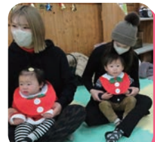
子どもたちがつけているスタイはスタッフからのプレゼントです