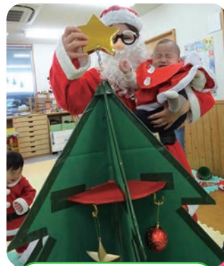
サンタと一緒に飾り付けをしました