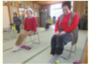
テニスボールで足のマッサージ

近所の人と出会って話をするのが、いきいき百歳体操の大きな魅力です。是非、お近くのサークルへご参加ください！