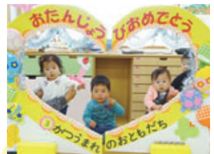
3月生まれのお友だち