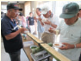
みんなで流しそうめん