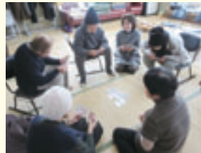
トランプを楽しむ様子