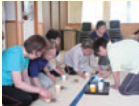
みんなで協力してお茶会