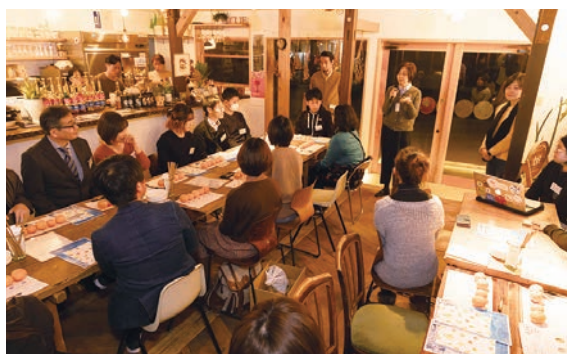
▲ 地元の方と参加者の交流会

その看護師の方からは「すぐにではないけれど移住を考えていて、このプロジェクトに参加した」ということを聞き、私も移住者であることを告げると、とても話が盛り上がりました。