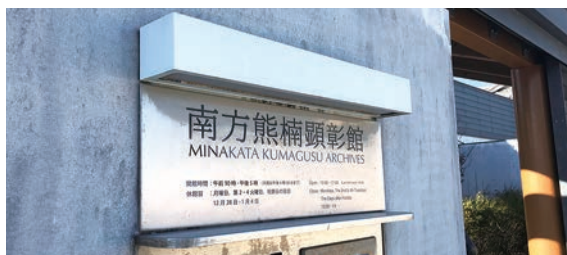
▲ 参加者と田辺の街歩きでいってきました。

和歌山県の活性化にも繋がるプロジェクトだと感じ、また、ワーケーションは美浜町にはうってつけの環境なんじゃないか。とも思いました。