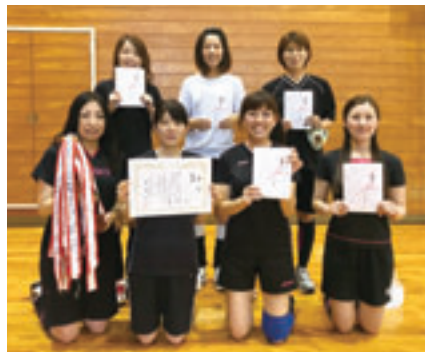
▲上田井 S C