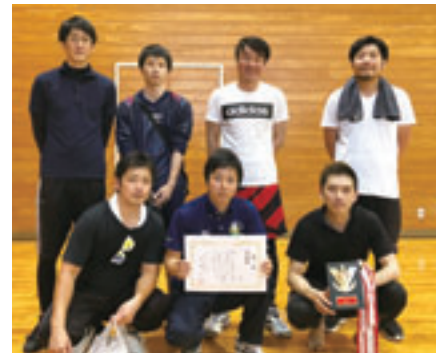
▲上田井 S C