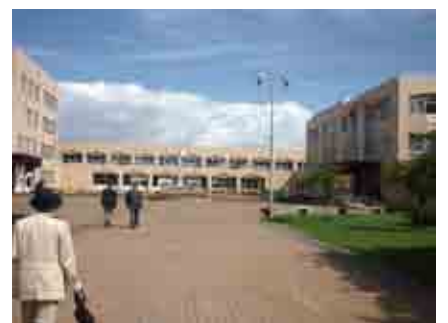
▲校門から小・中学校を臨む

ALTも入りT・Tで行ない、その 指導案作成を小・中の先生が 合同で作成する。小