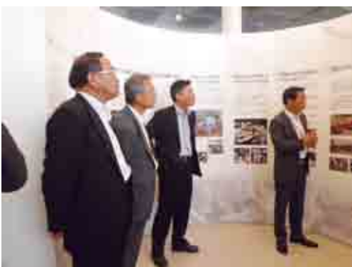
▲防災学習センター

また、災害時の駐屯地との連携や対策等を考えた時、自衛隊の高台移転や、「防災学習センター」のような防災研修・啓発施設と避難施設との兼用研究を進めて行くことが大事ではないかと考えます。