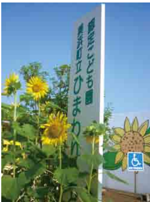
▲どこへ行くのだろう？ こども園

教育長は、以前より、幼小中連携教育の必要性を提唱しておられますが、何を継承して行くべきとお考えですか。 教育長 幼小中連携の大きな願いは、何と言いましても子どもたちの学力の向上、その基盤としての生活規律の確立を目指して取り組むのが、連携教育の大きなねらいだと思います。