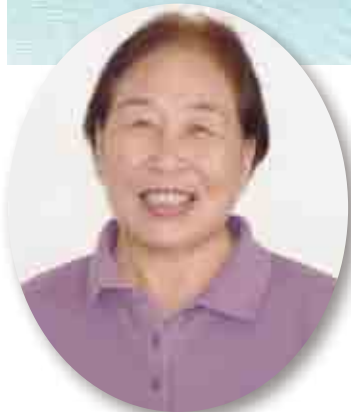
中西 満寿美 議員