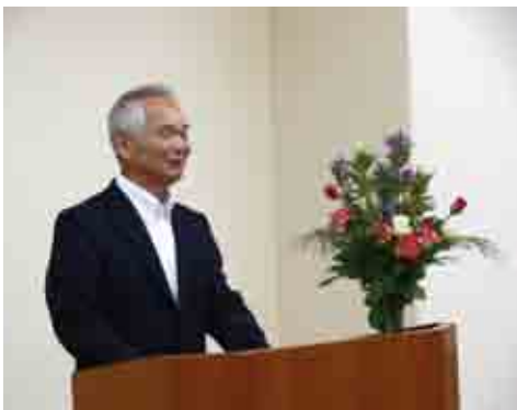
▲教育長退任式より

高度な医療の普及等による医療費の増大も見込まれることから、今後の国の動向も含めて注視し、対応していきたい。