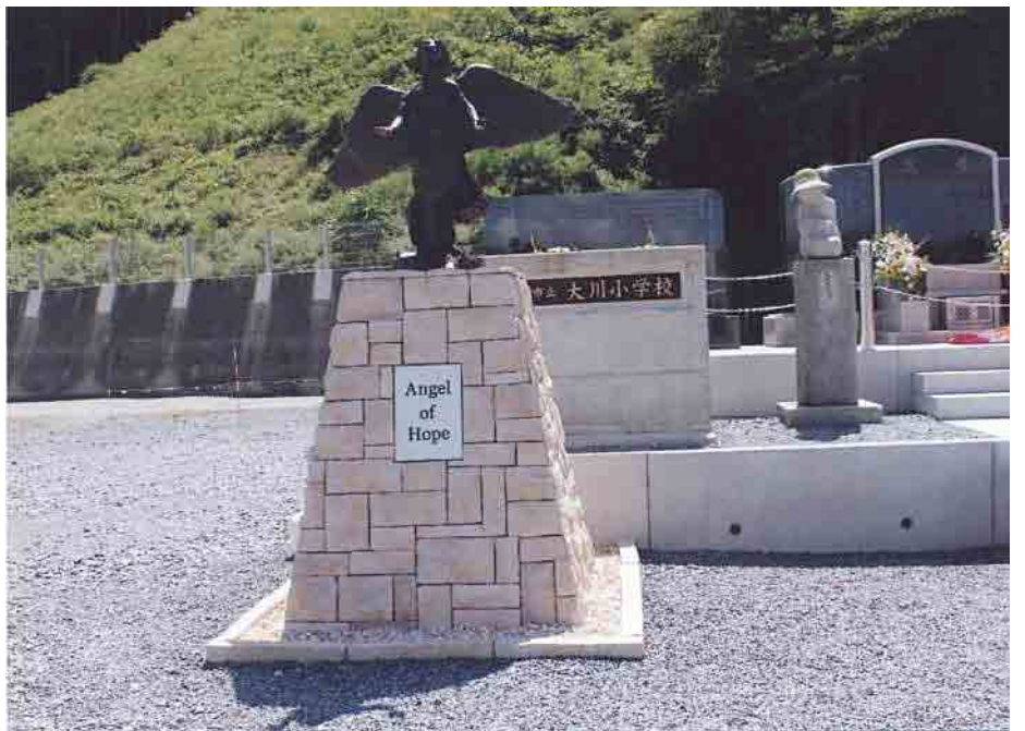
▲宮城県石巻市立大川小学校 慰霊碑

のため食料備蓄は1週間分と勧めているが対策は。 町長 備蓄は3日分である。備蓄の啓発は機会あるごとに 行う。