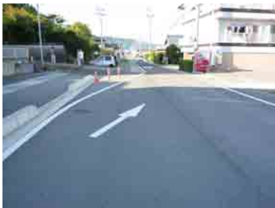
▲待たれる県道の拡幅

質問 現在の経過、進行状況は。 町長 常德寺付近から中央公民館南側の交差点までの拡幅工事は、平成12年度から順次工事がなされ、平成24年度に一応の完了を見た。 質問 一部残され急に狭くなっている部分は、通行量も多く普段の通行にも支障をきたしている上、大変危険である。 町長 残った部分（常德寺付近）については、地権者との話し合いが付かないまま、現在に至っている。 質問 近隣の住民も大変困っていると共に、いつ事故が起きるかわからない。 産業建設課長 県と町との協議の中では、今回の拡幅事業は一応完了したが、地権者との話し合いの進展次第では、狭