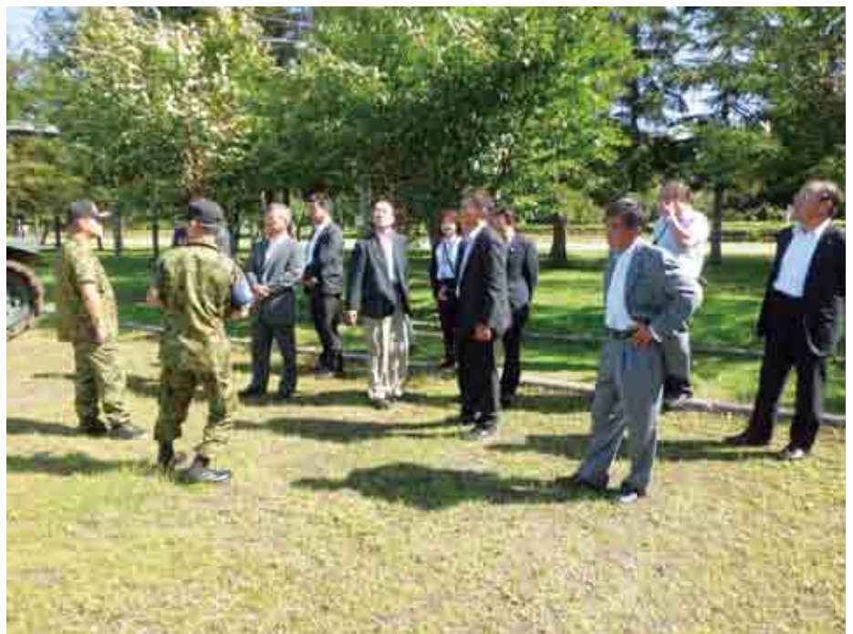
▲東千歳駐屯地の見学

東千歳駐屯地では昭和37年より現在の第七師団として改編され今日に至っていること事であり、さらにはかのぼること、昭和29年には現在のその原