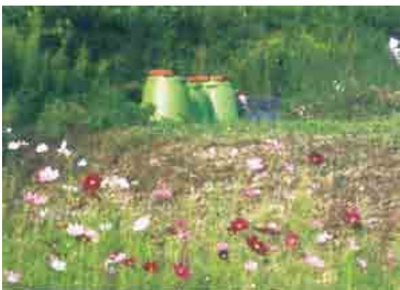
▲三尾「サークルいきごみ」のコンポスト