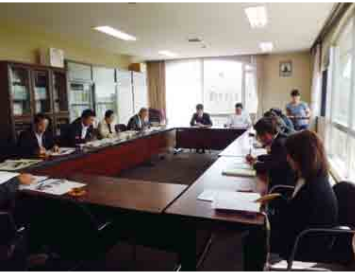
▲小中副校長より説明を受ける