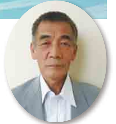
高垣 典生 議員

公的年金の支給開始年齢の引き上げが打ち出されている。内容は25年から27年度は61歳、28年から30年度は62歳、37年度からは65歳、年金制度を維持していくならいたし方のないことかと思う。