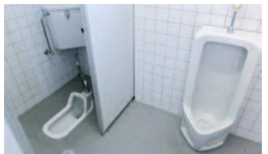
▲吉原東集会場トイレ

ただし、場所によっては大規模な工事が必要となる場合もあり、この場では約束は控えたい。