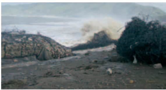
▲破壊された布団マット工

次の議案審議で「公営で運営」と、突然判断した理由は何か。 町長 確かに「いま一度検討」と答弁した。 言葉が足りなかった。 質問 公営なら、臨時職員の身分はどつするの？ また、開園時の園児数は201名、本年度の園児数は141名、すでに60名減少している。 今後、少子化が町の財政を圧迫していく可能性についての考えは？ 町長 園児数と財政をもっと少し見守っていききたい。 質問 特徴ある教育を考えるべき、専用の英語教諭を派遣して「ひまわりごも園に行ったら英語が話せるようになる」というのはどうか。 教育長 すばらしい提言。 今後の検討課題にする。