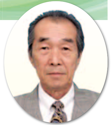
高野 正 議員