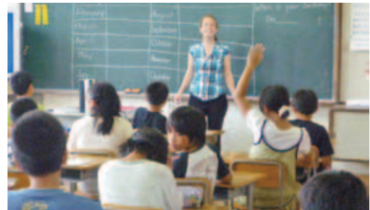
▲小学校A L Tによる英語の授業