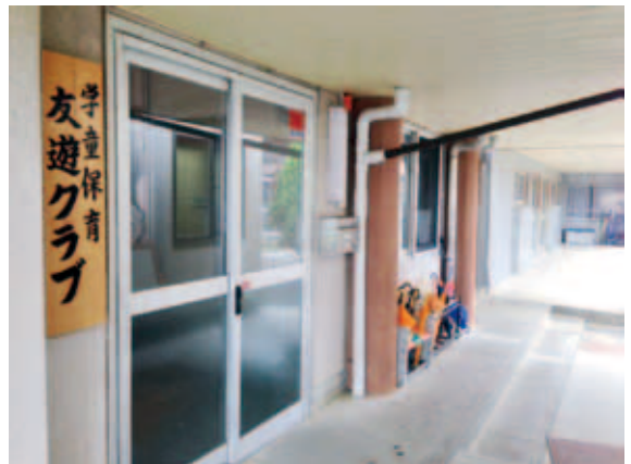
▲学童保育友遊クラブ

教育長 建物については町の財政の絡みもあり、今後見据えていかなければならない。 質問 この友遊クラブ全体