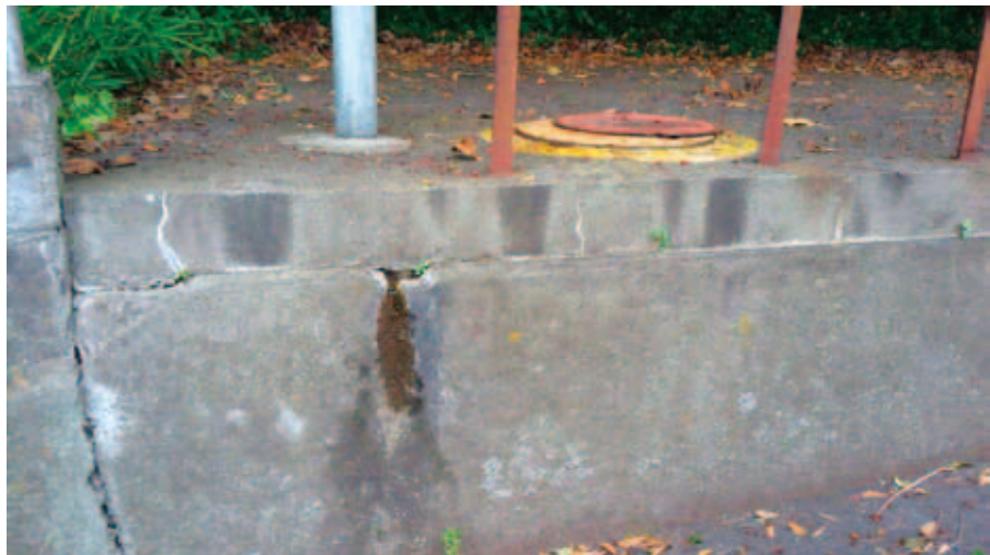
▲漏水している防火水槽

水槽も所在については掌握出来ていますが、どれだけ漏れているかなどは掌握出来てないと思います。