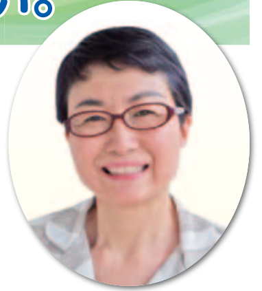
龍神 初美 議員