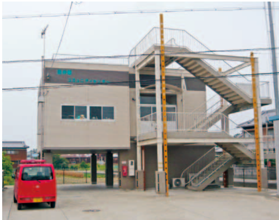
▲田井畑コミュニティセンター