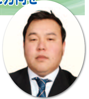
谷 重幸 議員