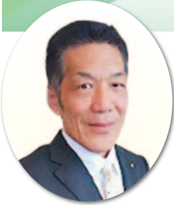
碓井 啓介 議員