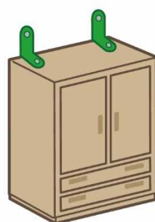
L型金具 (上向き取付け)