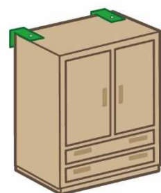
L型金具 (下向き取付け)