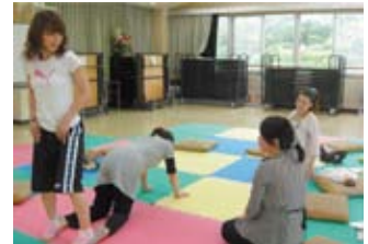
マタニティーヨガ

生まれてくる赤ちゃんのパパやおじいちゃん・おばあちゃん、ご家族の方も、ぜひ、一緒に参加してください♪