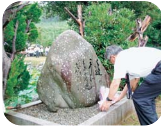
故大賀一郎博士の 顕彰碑に献花