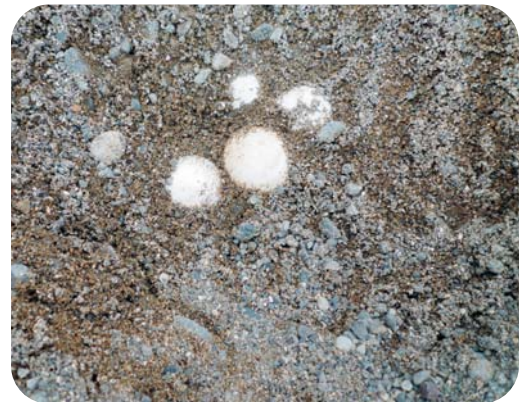
無事にふ化しますように。。。