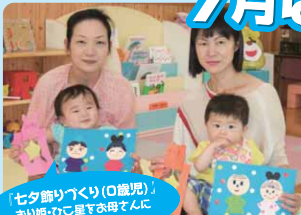
『七夕飾りづくり(0歳児)』 おり姫・ひこ星をお母さんに 作ってもらったよ。