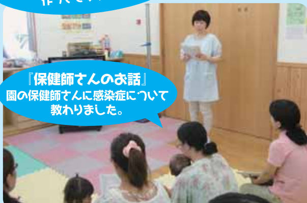
『保健師さんのお話』 園の保健師さんに感染症について 教わりました。