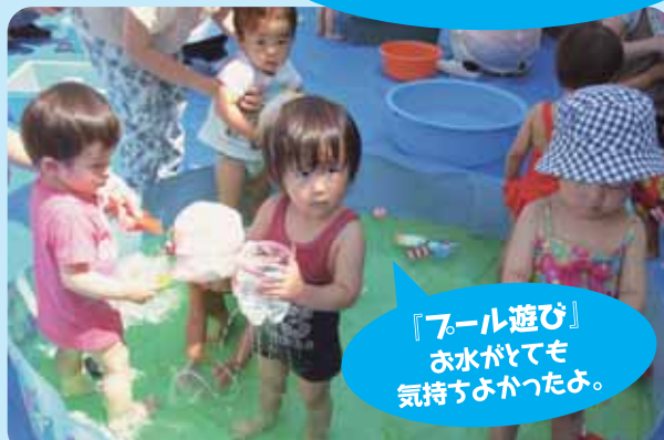
『プール遊び』 お水がとっても 気持ちよかったですよ。