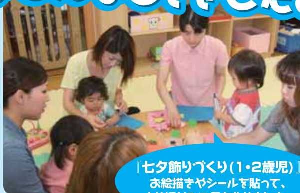
『七夕飾りづくり(1・2歳児)』 お絵描きやシールを貼って、 おり姫やひこ星を作りました。