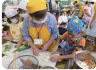
包丁を使って材料を切ったよ☆

地産地消に努め、食材はJAグリーン日高より提供いただきました。自分たちで作った料理は「おいしい！」と、おかわりをする子もいました。