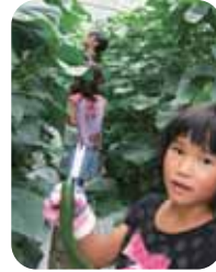
きゅうりを収穫したよ！