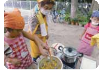
カレーを一緒に作ったよ♪