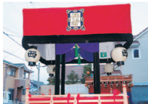
四ツ太鼓 太鼓・天幕

この宝くじ助成金(一般コミュニティ助成事業)は、財団法人自治総合センターが宝くじの事業収益を還元する目的で、市町村や地区住民のコミュニティ組織、自主防災組織などが行う活動に助成を行い、コミュニティの健全な発展を図ると共に、宝くじの普及広報を行っているものです。