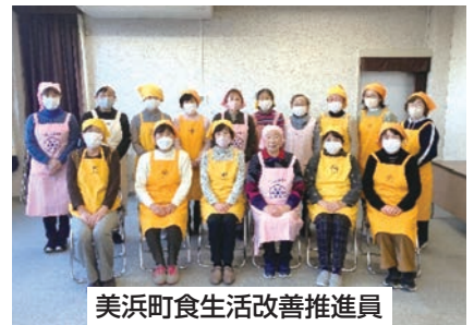
美浜町食生活改善推進員