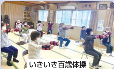
いきいき百歳体操