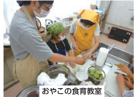
おやこの食育教室

栄養バランスのとれた食事を松洋中学校3年生と一緒に作ります。中学生から「食の大切さを学べた。」「作るのは大変だったけれど、みんなで作って食べたのが楽しかった。」等の声がありました。