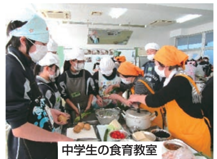
中学生の食育教室