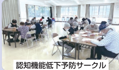
認知機能低下予防サークル