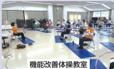
機能改善体操教室