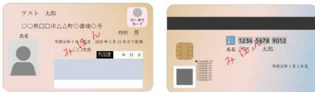
(表面) 個人番号カード (裏面)